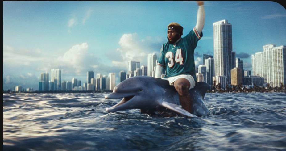
Riding a dolphin with such abandon wouldn't have been possible without AI