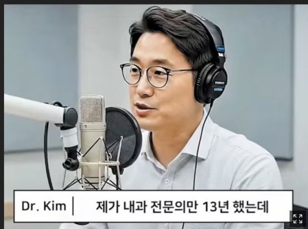
소셜미디어(SNS)에 돌고 있는 다이어트 약 광고. 광고 속 의사는 AI(인공지능)로 만든 가짜다.